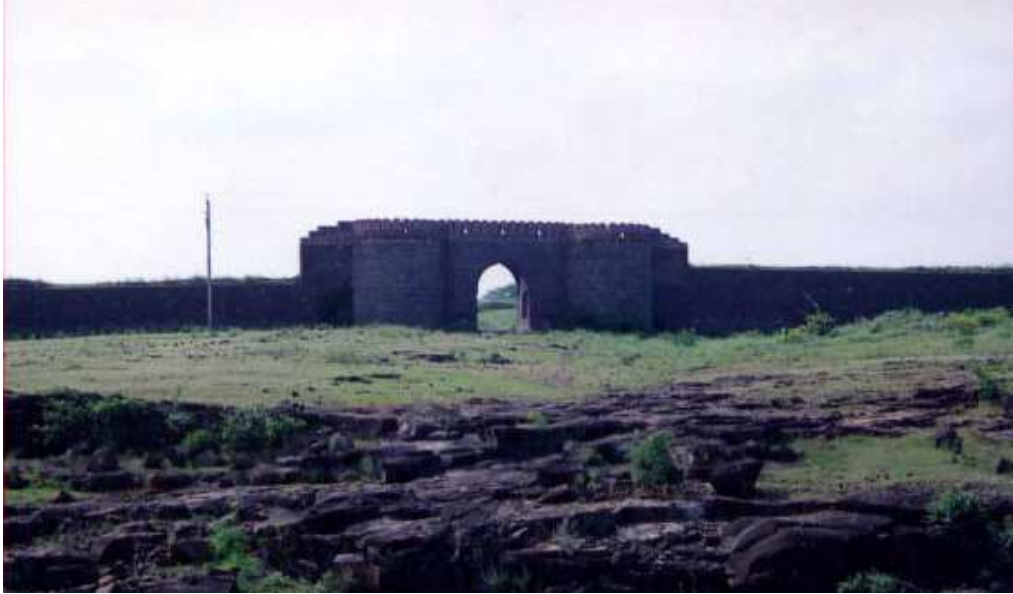
पळशी येथील तटबंदीमध्ये असणारा दिल्ली दरवाजा