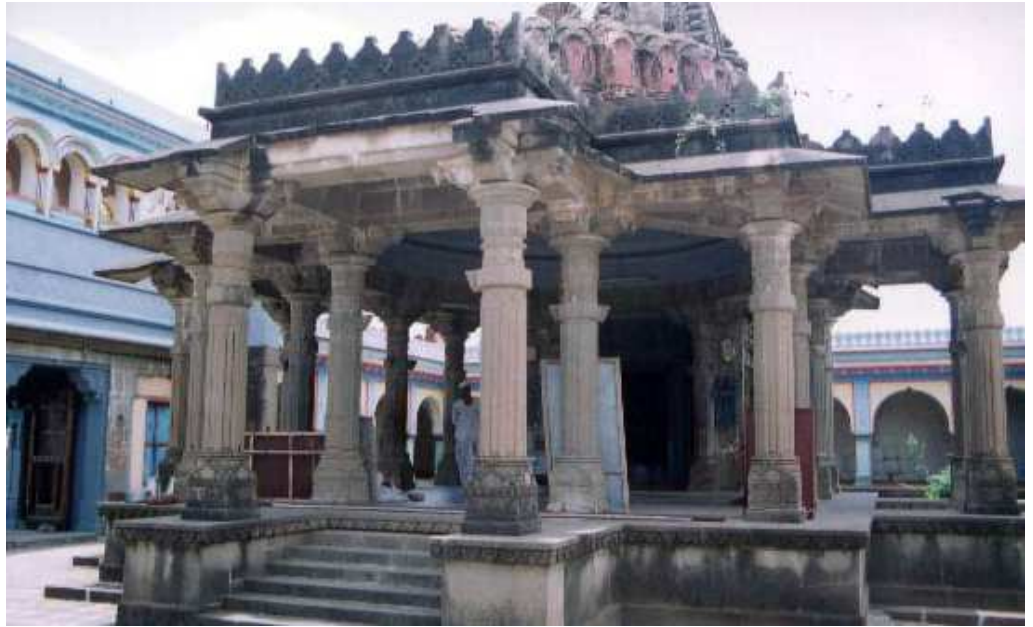
पळशी येथील विठ्ठल मंदीरासभोरील १८ खांब