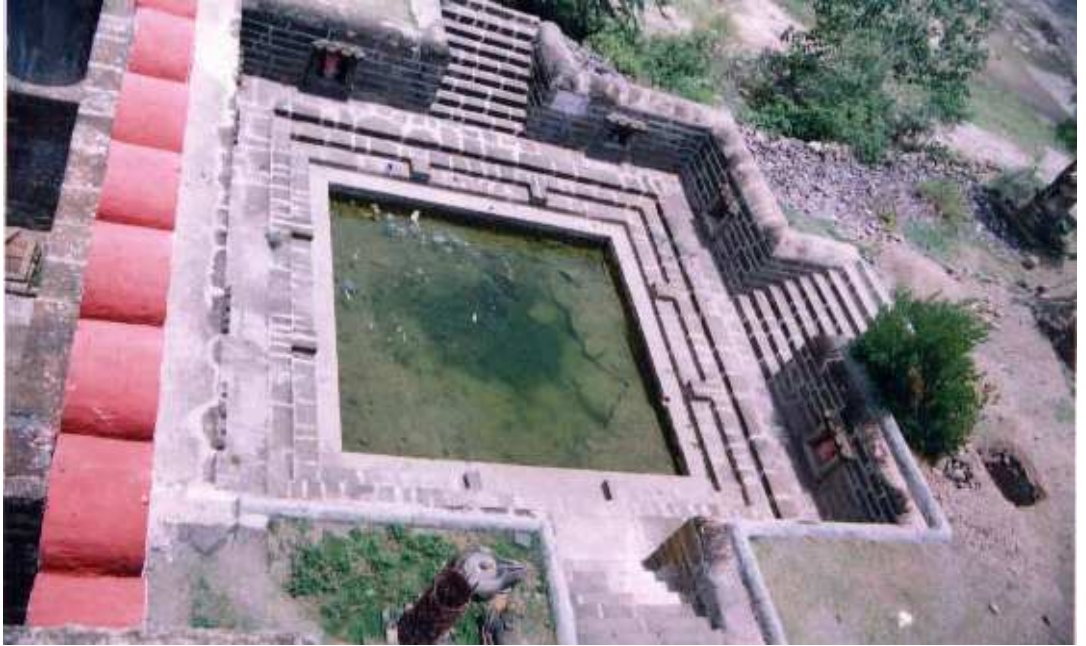
पळशी येथील विठ्ठल मंदीराच्या मुख्य दरवाजा समीरील कुंड