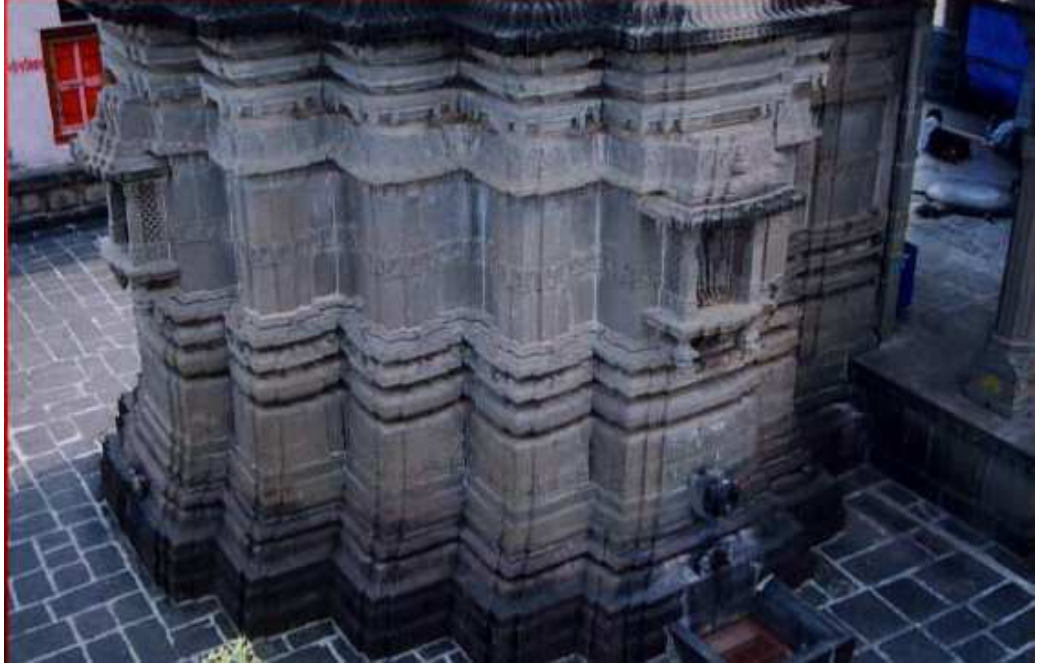
पळशी येथील विठ्ठल मंदीरावरील नक्षी