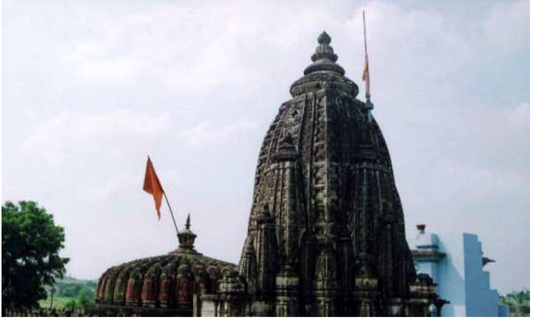
पळशी येथील विठ्ठल मंदीराचा कळस