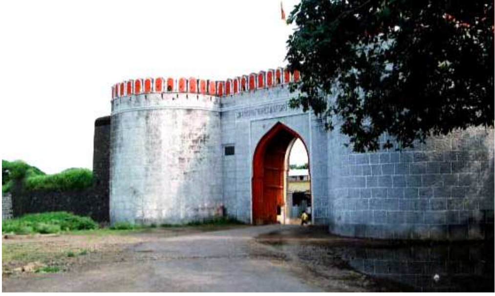
पळशी येथील तटबंदीमध्ये असणारा मुख्य दरवाजा