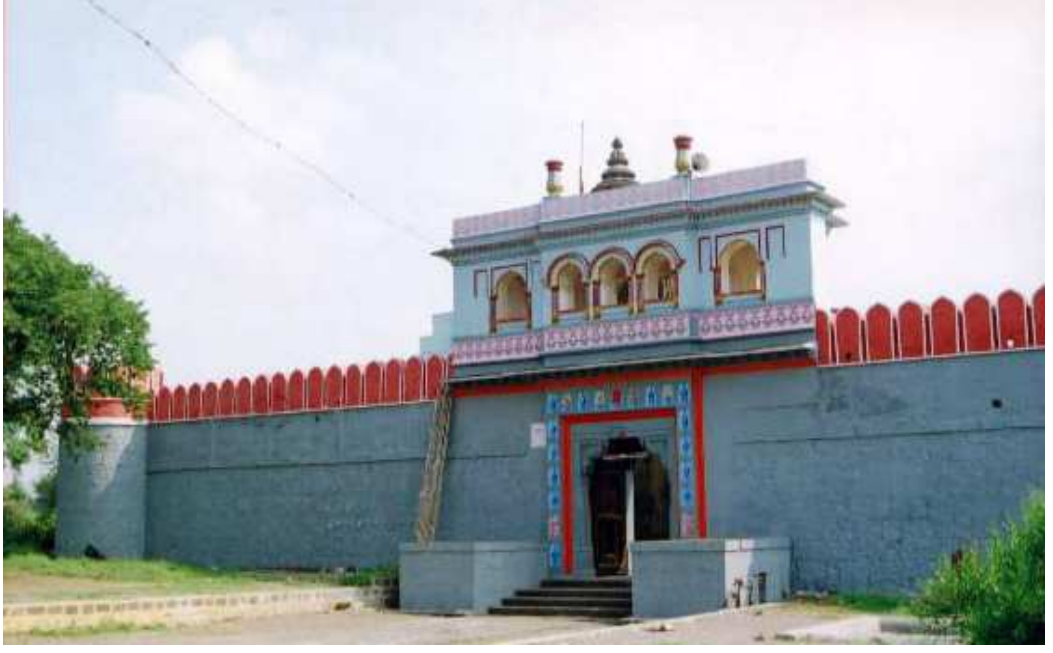
पळशी येथील विठ्ठल मंदीराचे प्रवेशद्वार.