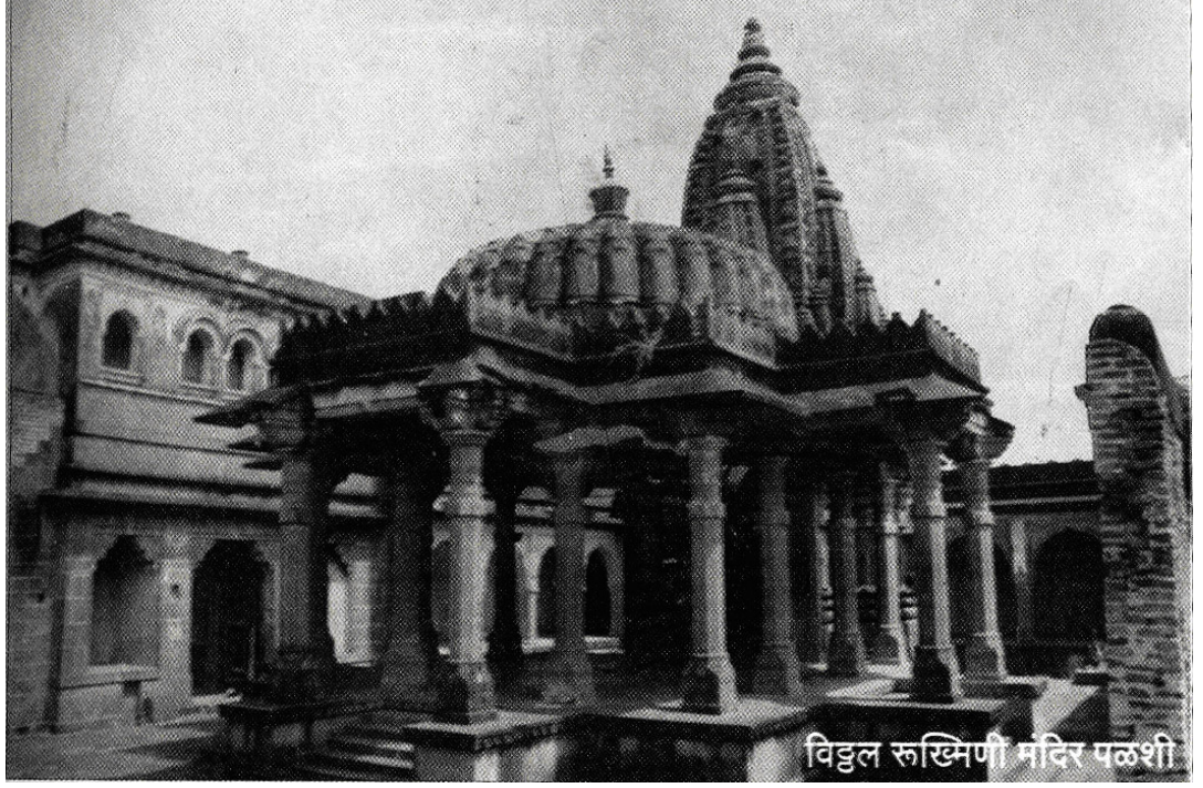
विठ्ठल-रुक्मिणी मंदीर पळशी