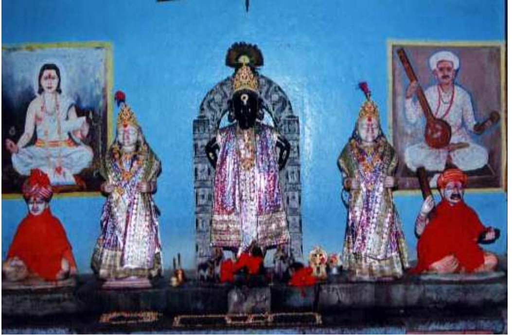
पळशी येथील विठ्ठल मंदीरातील मुर्ती