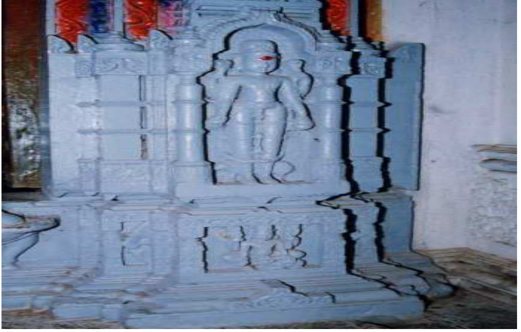
पळशी येथील विठ्ठल मंदीरावरील जयविजयची मुर्ती