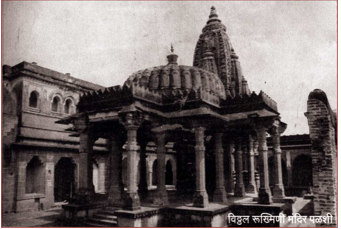
विट्ठल रुक्मिणी मंदिर पलशी