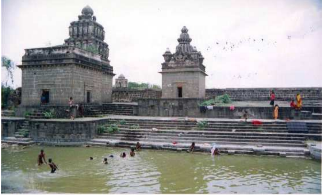
पळशी येथील विठ्ठल मंदीराच्या पश्चिमेकडील भागात असणारी शिव व गणेश मंदिरे