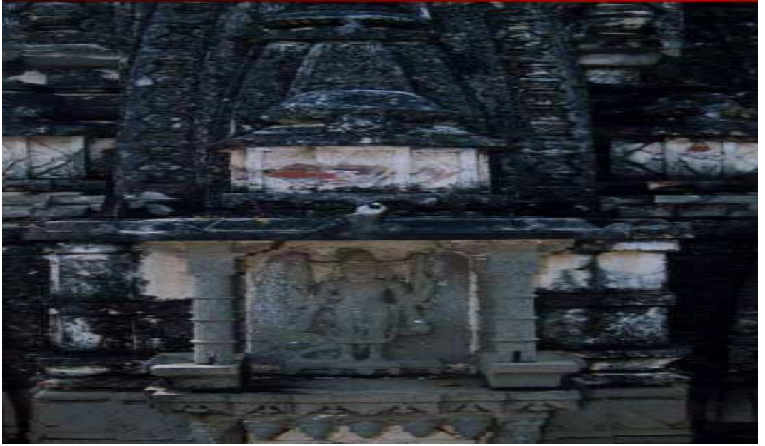
पळशी येथील विठ्ठल मंदीरावरील गरुडध्वजाची मुर्ती