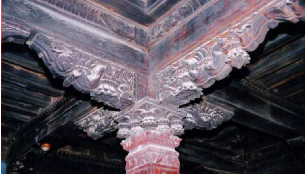
पळशीकर वाड्यातील लाकडावरील कीरीवकाम व कलाकुसर.