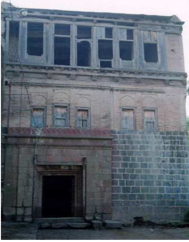
पळशीचा शिल्पांकित राजप्रसाद - पळशीकर वतनदारांचा वाडा