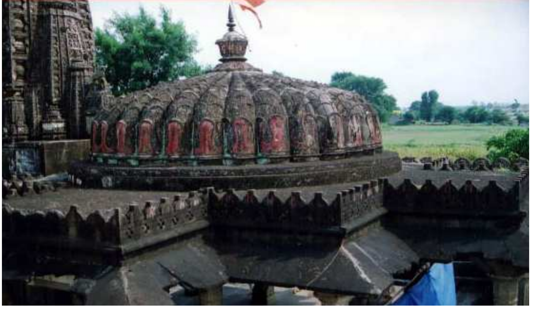
पळशी येथील विठ्ठल मंदीरावरील कमळाकृती कळस